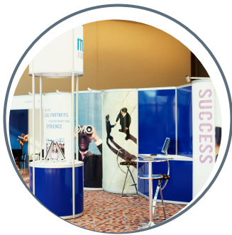
Plus de 120 exposants