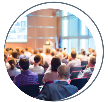
Conférences et ateliers

Pour développer durablement le tissu économique de la région